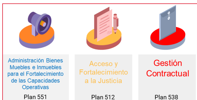
Imagen N° 3. Elaboración propia. Fuente: Reporte acciones Portal MIPG – ITS.

registrará en el portal MIPG – ITS, así mismo, se reflejará en el informe de seguimiento del PMI que se emita a corte 30 de septiembre 2025.